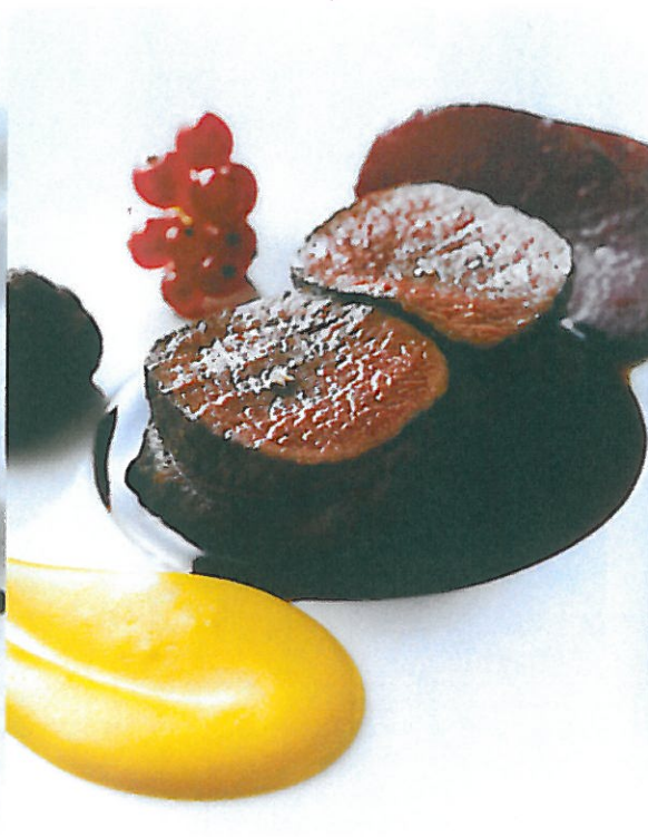
えぞ鹿モモ肉の岩塩包み 栗かぼちゃのピューレ シュブリユソース カシス風味 岩塩で蒸し焼きにしているため、 とろけるように柔らかく 味わい深い仕上がりに。