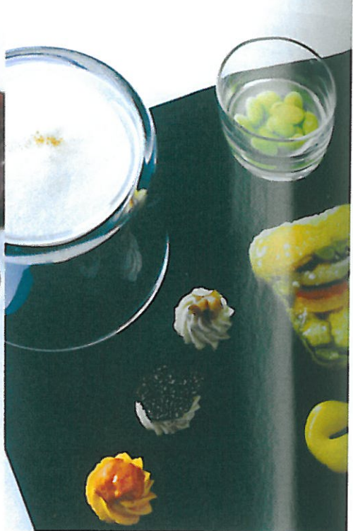
有機野菜のバリエーション 13種の野菜を使ったテリーヌをはじめ、 マリネした黒枝豆のトマトゼリー寄せ、 ゆりねやれんこんのムースなど、 まさに食感や風味が驚くほど豊か。 野菜を堪能できる一皿。

「すべてのお客様にとってのホー ムになれば」とシェフ。小さな子 ども連れにもやさしい一軒です。