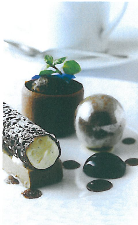
マスカルポーネと エスプレッソのティラミス風 アマレットソース ティラミス、この店ならではの 新しい視点でとらえると、 楽しい一皿が完成。